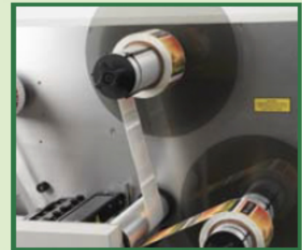
Aufwickeln der Rollen auf 2 Aufwickelstationen